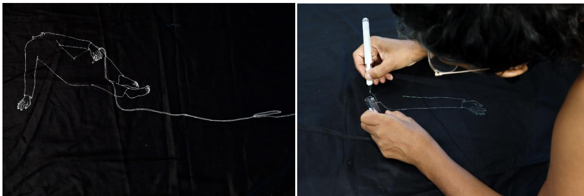
Détails des broderies accompagnant l'installation de Myriam Omar Awadi