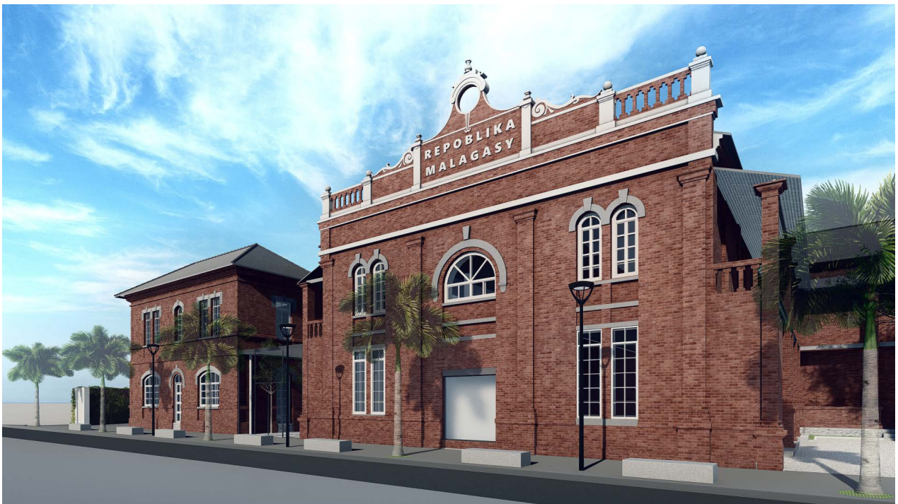
Nouvel espace de la Fondation H, Antananarivo, Madagascar © Fondation H et Architecture Otmar Dodel

Première fondation privée d'art contemporain à Madagascar et première institution culturelle de cette envergure dans le pays, la Fondation H inaugurera son nouvel espace de 1 500 m 2 , entièrement gratuit, en plein centre-ville de la capitale malgache, le 28 avril 2023.